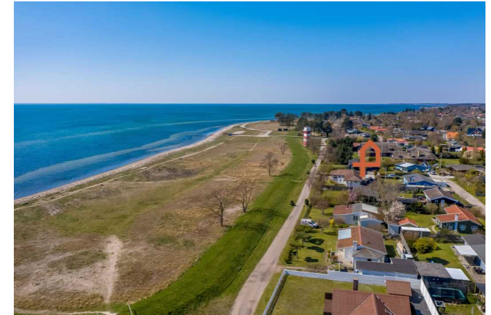
Luffoto over ejendommen & området