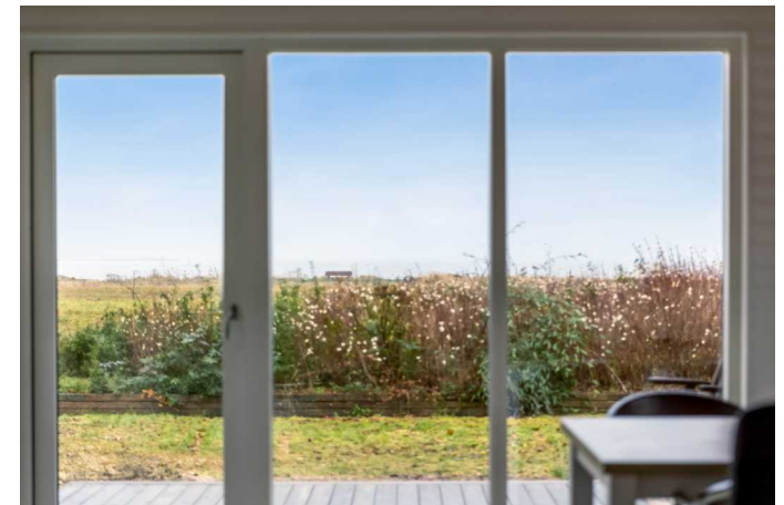
Udsigten fra stuen