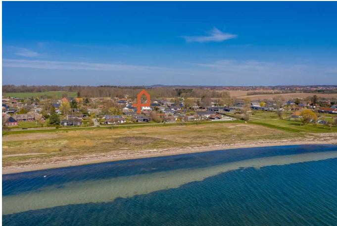
Luffoto over ejendommen & området