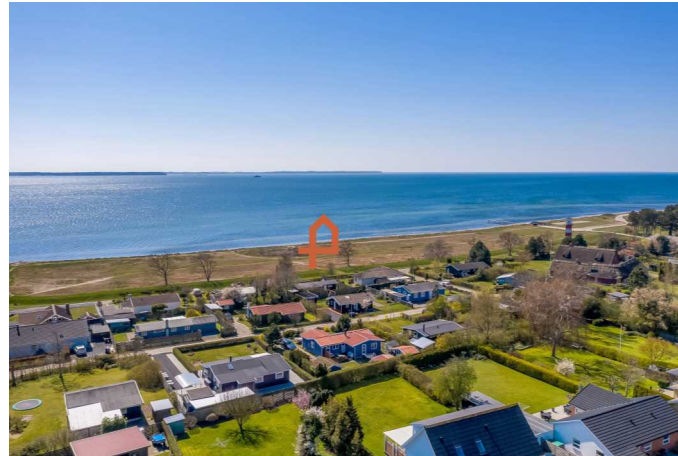
Luffoto over ejendommen & området