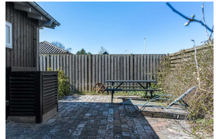
Terrasse bag ejendommen