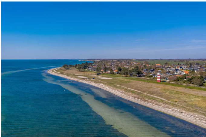
Luffoto over ejendommen & området