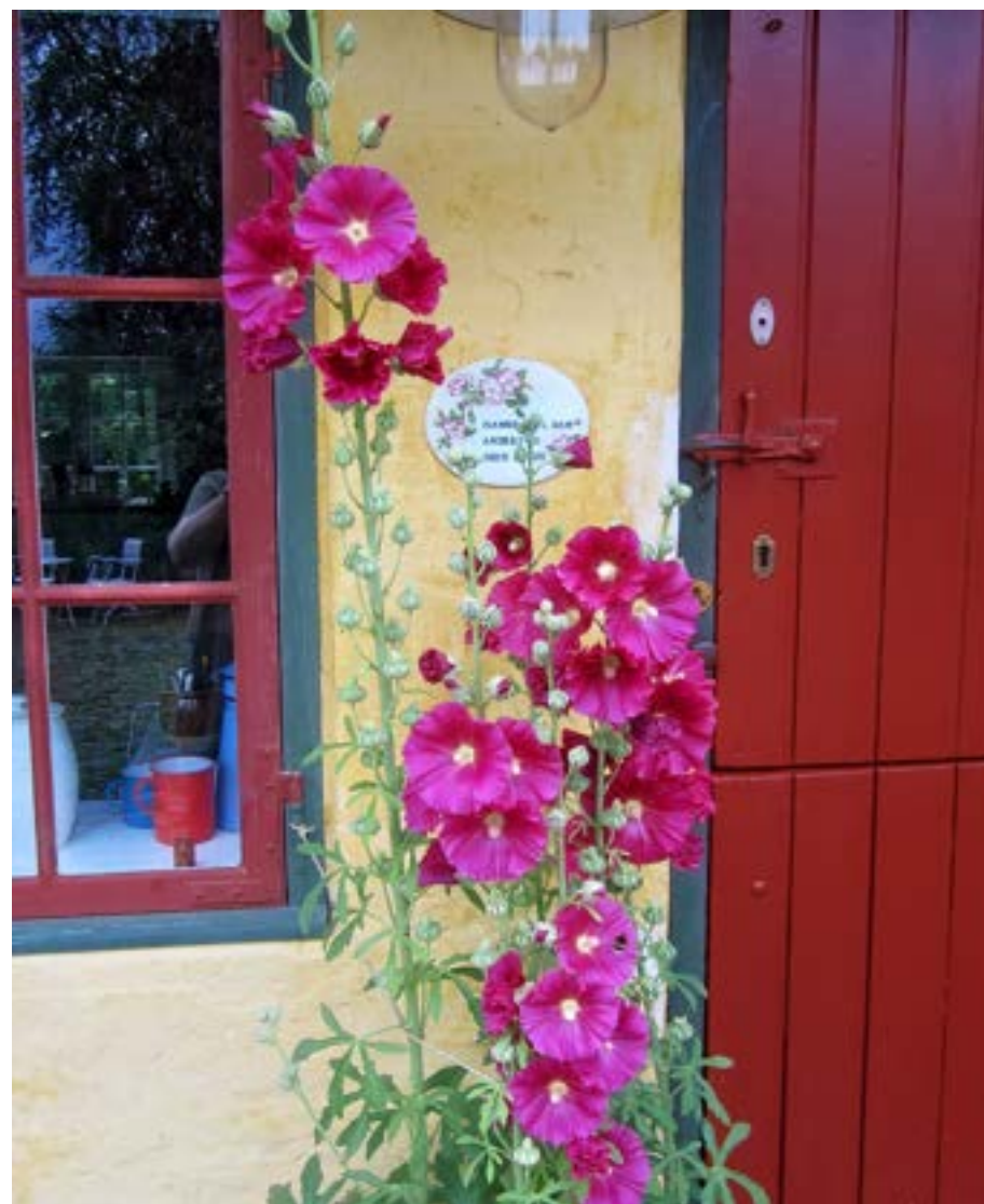
Påske - og pinseliljer i hundredvis under det gamle valnøddetræ er en fryd for øjet.