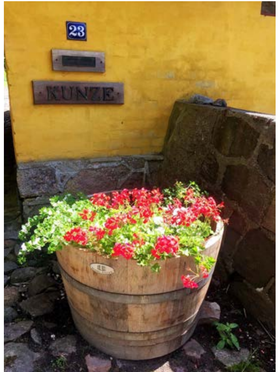
De nuværende ejere har boet her i 50 år.