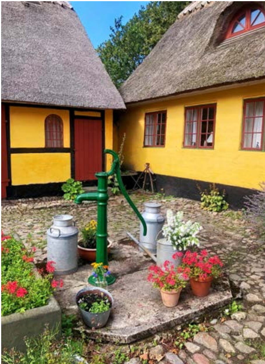
Den gamle brønd tømte vi for nogle år siden i håb om at finde våben fra Gøngehøvdingens besøg på gården i 16-hundredtallet.