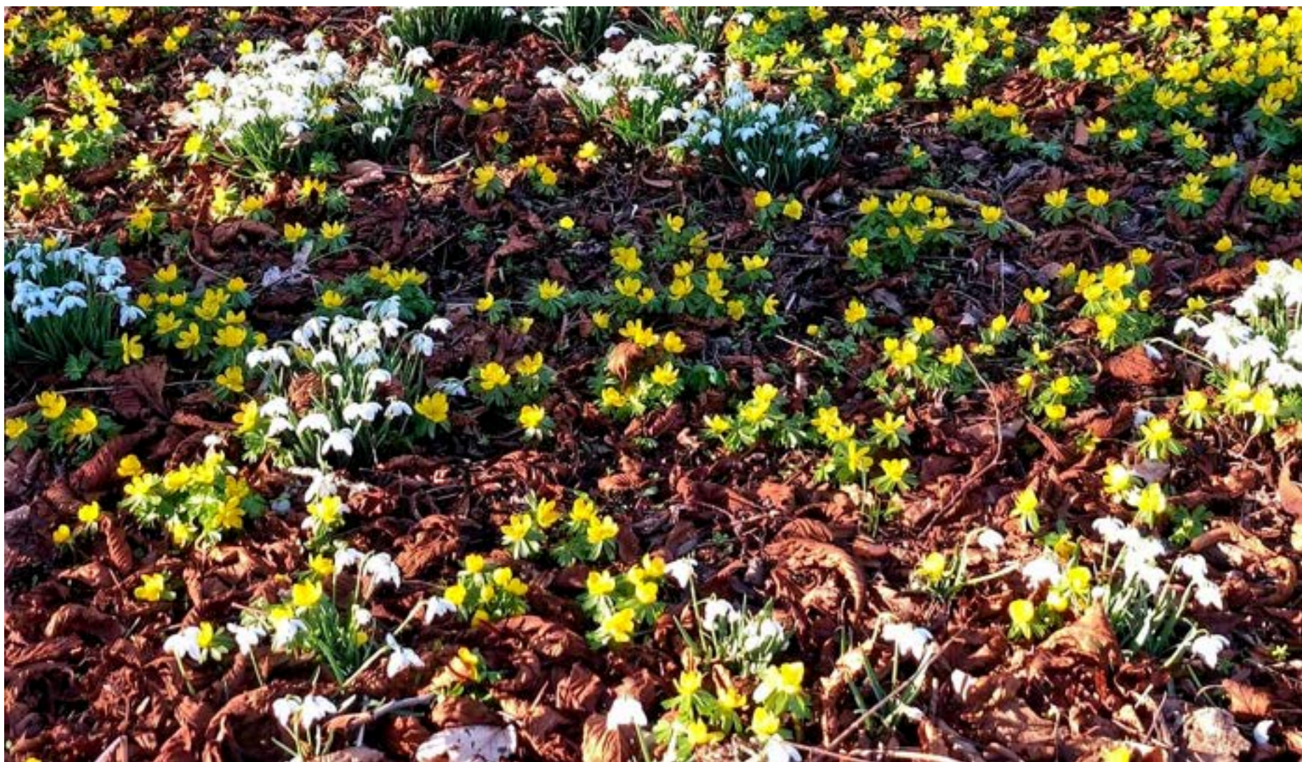
Og så er foråret på vej! Erantis, vintergæk, hvide og gule anemoner pibler op af jorden